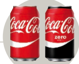
Coca Cola normal y Zero 333 ml.