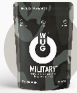
WUG Military 8 Unidades