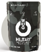
WUG Military (1 Unidad)