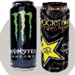
Monster y Rockstar 500 ml.