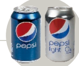
Pepsi normal y Ligth 360 ml.