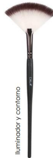
Iluminador y contorno