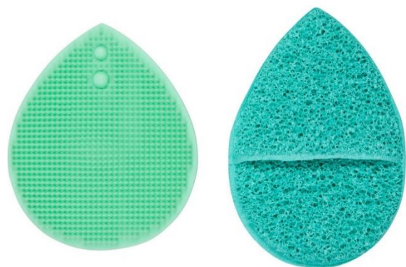
Esponja exfoliante + cepillo de silicona

Esponjas limpiadores suaves que eliminan cualquier residuo de maquillaje, suciedad e impurezas. Las hay también exfoliantes, para una limpieza más profunda y de silicona para además de limpiar, realizar un suave masaje sobre la piel del rostro.