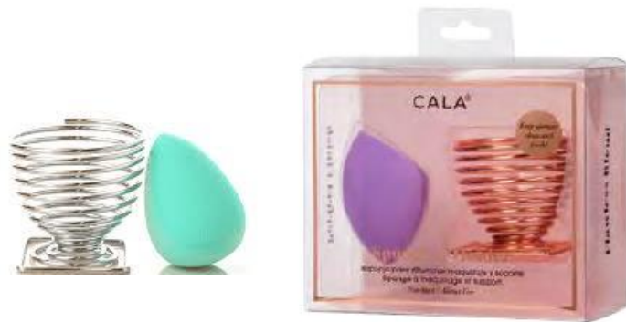
Espojna + soporte

Espojas con soporte, dúos de esponjas y accesorios de limpieza para completar tu neceser de maquillaje y aplicar la base de la mejor manera posible. Diferentes formas y colores para todos los gustos y necesidades.