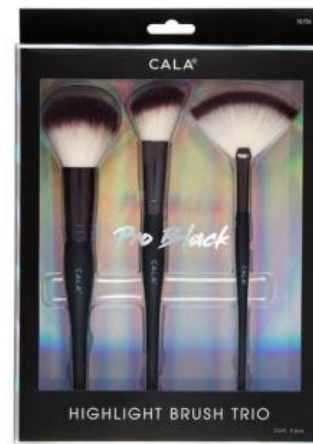
Trío de brochas iluminadoras