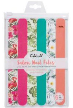
Kit de 6 limas de uñas