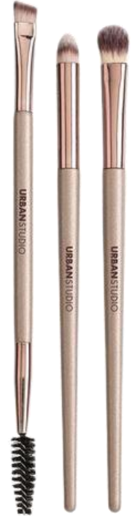
Set de ojos