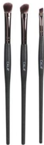
Trío de brochas de ojos