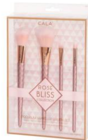
Set 4 brochas rostro y ojos