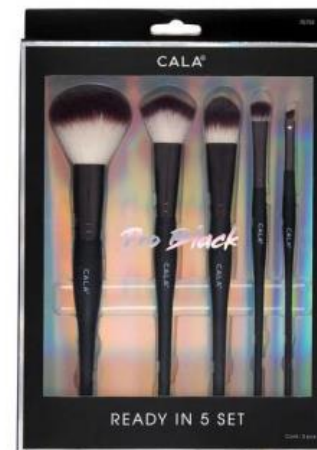
Set 5 brochas rostro y ojos