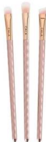
Trío de brochas de ojos