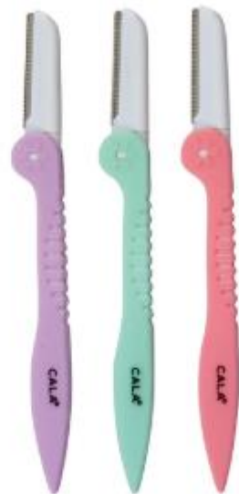
Pack de 3 cuchillas para cejas (plegable)