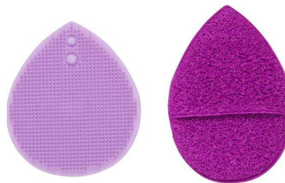
Esponja exfoliante + cepillo de silicona