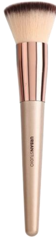
Base de Maquillaje

Tienes disponible una brocha para polvos, otra para base de maquillaje y dos sets: uno de rostro y otro de ojos.