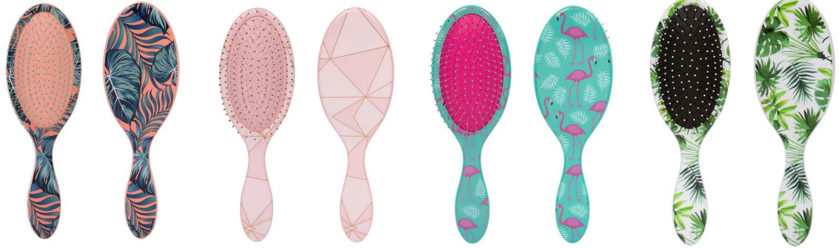
Cepillos Wet&Dry Estampados

Prácticos cepillos para todo tipo de cabellos secos o mojados. Peinan con facilidad, no dan tirones y da un suave masaje al cuero cabelludo. Su mango ergonómico facilita su uso y manejo.