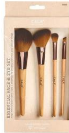
Set 4 brochas rostro y ojos