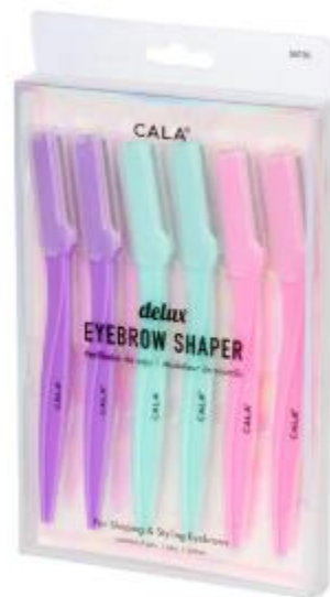
Pack de 6 cuchillas para cejas