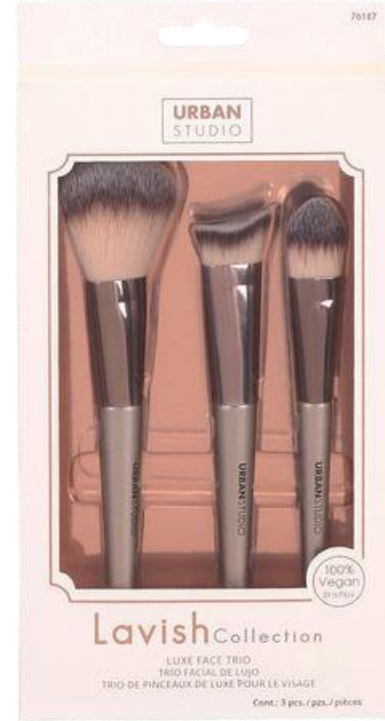
Set de rostro