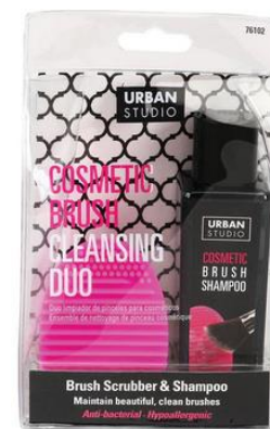
Limpiador de Brochas + Jabón