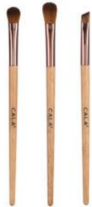
Trío de brochas de ojos