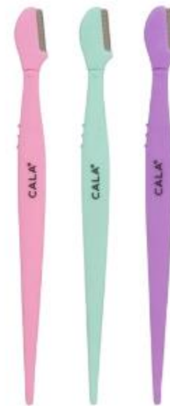
Pack de 3 cuchillas para cejas (precisión)