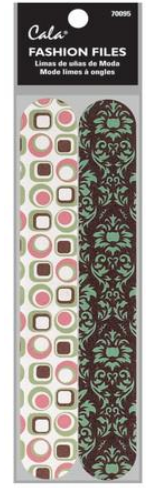
Packs de 2 limas de uñas