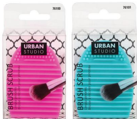
Limpiador de Brochas