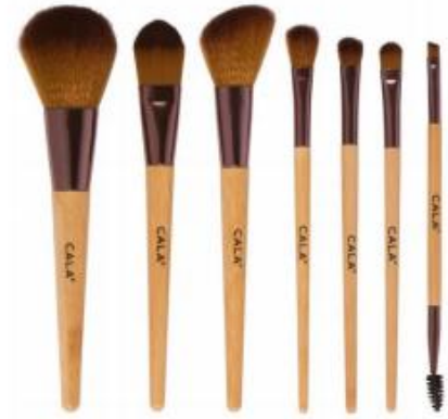
Set 7 brochas rostro y ojos