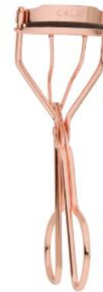
Rizador de pestañas