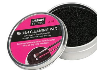
Limpiador de Brochas