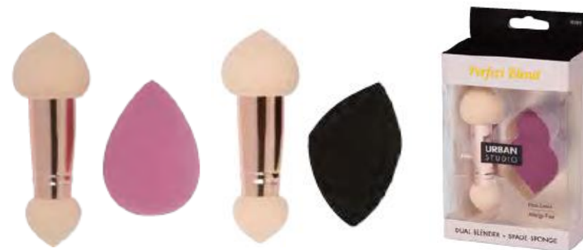
Dúo de Espojna + Blender