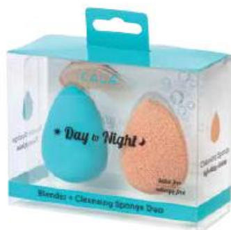
Espojna maquillaje + Espojna limpiadora